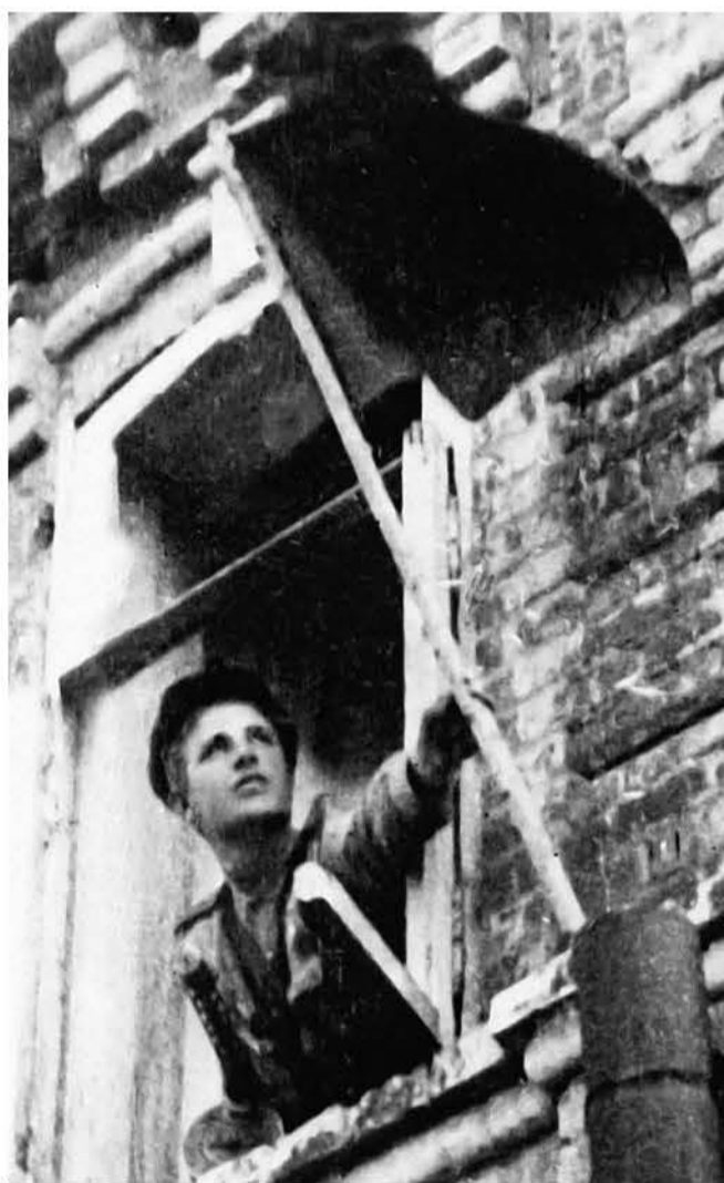
Фото 1. Водружение знамени освобождения 5 августа 1943 года

День освобождения Белгорода 5 августа всегда почитаем горожанами. С октября 1941 года город находился под тяжким игом фашистской оккупации. Множество городских зданий и сооружений было разрушено, а белгородцы уничтожались, насильно угонялись в рабство в Германию. Но после битвы у Прохоровки наши войска 3 августа 1943 года перешли в наступление на занятый врагом Белгород. И уже через два дня с боем в город первыми ворвались воины 89-й Гвардейской стрелковой дивизии, за ними бойцы 305-й и 111-й стрелковых дивизии. Символом освобождения Белгорода стало красное знамя над ныне сохранившимся старым двухэтажным домом № 25 на Белгородском проспекте (фото 1). Вечером 5 августа 1943 года впервые с начала боевых действий в Москве прогремел артиллерийский салют в честь освобождения Орла и Белгорода.