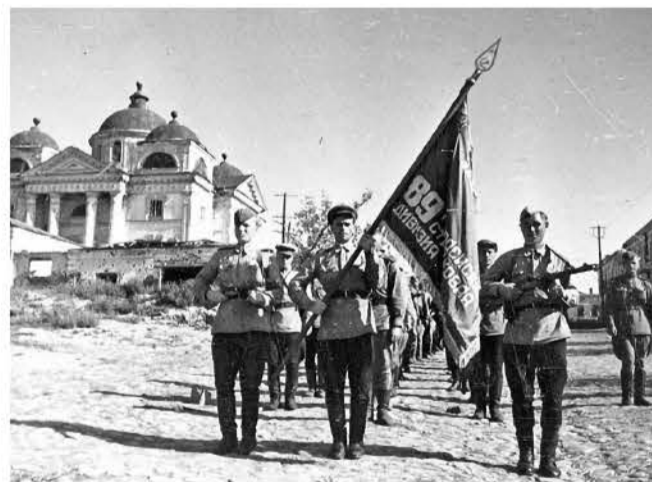
Фото 3. Воины 89-й Гвардейской стрелковой дивизии идут по ул. Попова