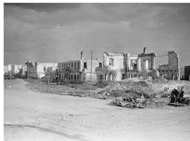
Фото 2. Южная, нечетная сторона Свято-Троицкого бульвара. Вид со стороны пр. Б.Хмельницкого