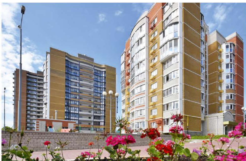
ЖК «На Некрасова»

И, конечно же, все эти решения требуют сравнительно более высоких затрат, чем у других застройщиков, но это наш принцип – не экономить на качестве, за что нас и ценят!