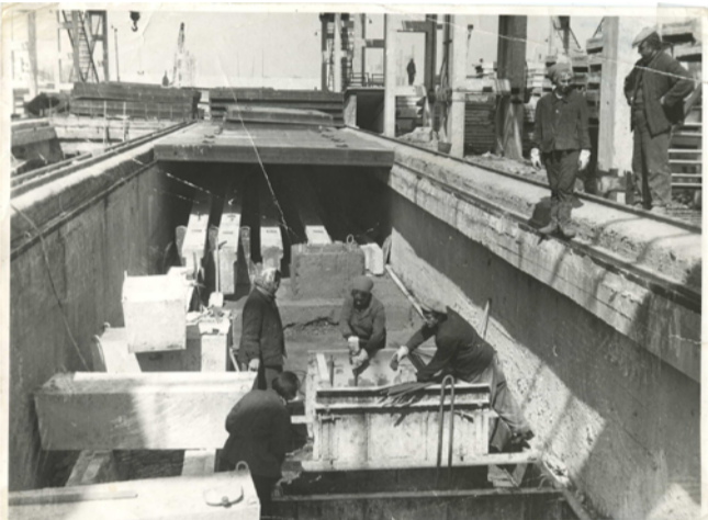
1970-е г. Полигон ЖБИ

Эти подсобные производства располагались в предместье Белгорода, в Мачуриной роще (ныне Сосновка), поэтому и первый адрес нашего предприятия был «КПП – Мачурина роща». С 40-х годов на этой территории находилась колония для заключенных. С 1953 года, когда заключенные были переведены в другое место, помещения производственных цехов, которые здесь располагались, были отданы в распоряжение СУ-1 и послужили начальной базой для нашего будущего завода.