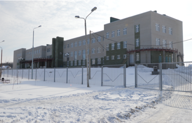
Школа в мкр «Новый-2»

В январе 2018 года Корпорация ЖБК-1 приступила к строительству общеобразовательной школы в ЖК «Новая Заря». Новая общеобразовательная школа рассчитана на 1000 мест, будет оснащена бассейном, спортивным и актовым залами, стадионом с качественным