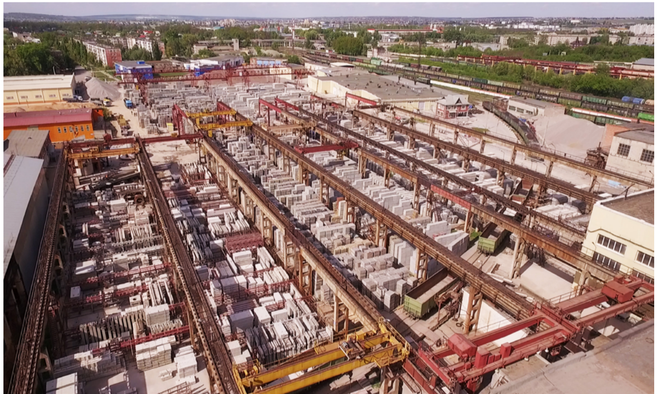
Территория завода 2017 г.