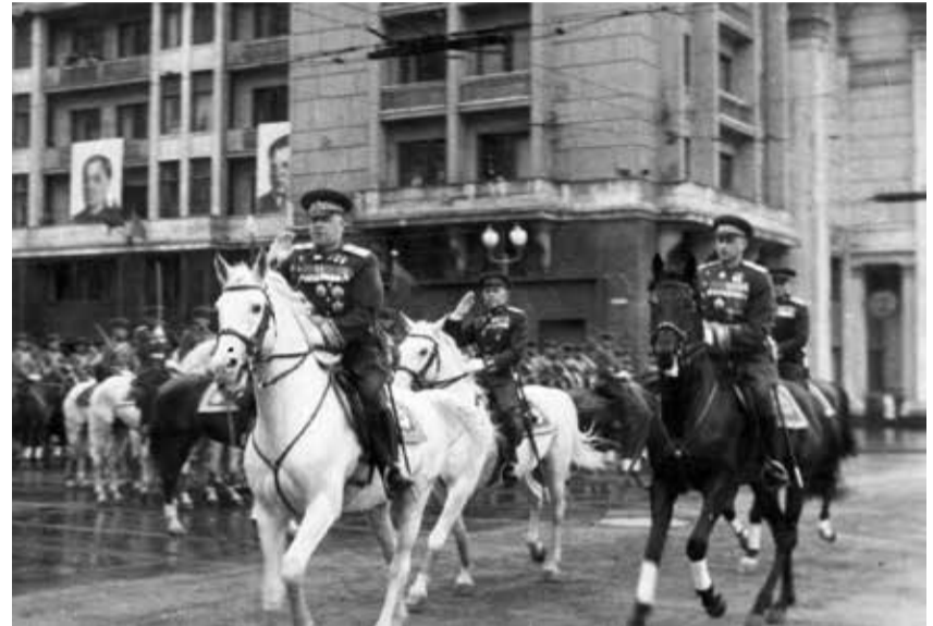
24 июня 1945 года. Маршалы Победы Георгий Жуков и Константин Рокоссовский принимают Парад.

Говоря о решении отложить проведение праздничного парада, президент РФ Владимир Путин упомянул о том, что выбор нового срока будет зависеть от эпидемиологической ситуации в стране. Теперь этот день обозначен – 24 июня, поскольку является памятной датой и прямо связан с 75-летием Победы. В этот день в 1945 году состоялся первый в истории парад Победы.