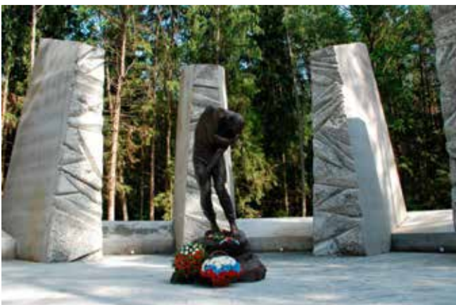
Памятник «Расстрел» на мемориальном комплексе «Катынь»

Об уничтожении польских офицеров под Катынью, в котором, якобы, виновен советский НКВД, немцы заявили в апреле 1943 года. Но «известно, что гитлеровцы уничтожали польскую интеллигенцию и на территории самой Польши, например, расстрел под Варшавой (так называемый «Пальмирский расстрел» 1940 года). А в Катыни они рас-