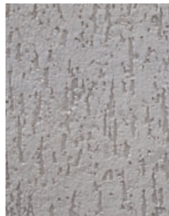
Варианты фасадных панелей с фактурным слоем