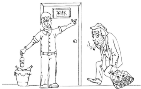
Сосед-выпивоха завидует моей квартире и моему здоровью.