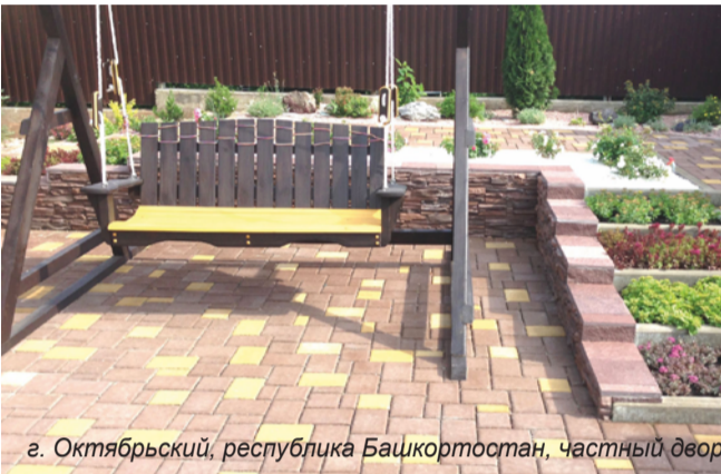
г. Октябрьский, республика Башкортостан, частный двор

Тротуарная плитка и элементы благоустройства производства ЖБК-1 имеют большой спрос не только в Белгородской области, но и в других регионах: Курск, Краснодар, Сочи, Геленджик, Анапа, Воронеж, Липецк, Казань, Ростов-на-Дону, Тольятти, Ставрополь, Ижевск, Сургут, Нижневартовск, Архангельск и др. К настоящему времени плитка ЖБК-1 отгружается более чем в 50 регионов России, включая Крайний Север и Дальний Восток, и даже за пределы России, например, на остров Шпицберген в Северном Ледовитом океане. Плиткой Завода обустроены гостиничные комплексы и набережные горнолыжного курорта «Роза Хутор» г. Сочи (олимпийский объект). Площадь Ленина в Воронеже, набережная в Липецке, центральные улицы, парки и площади в Курске, Орле, Лисках, Самаре, Россоши, Нововоронеже и многих других городах. Всего за 20 лет с применением продукции ОАО «Завод ЖБК-1» было благоустроено почти 20 миллионов квадратных метров территорий.